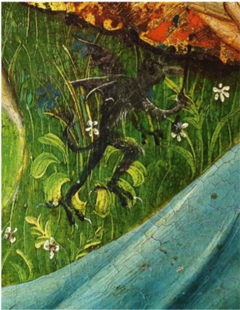
Detail aus dem linken Altarflügel