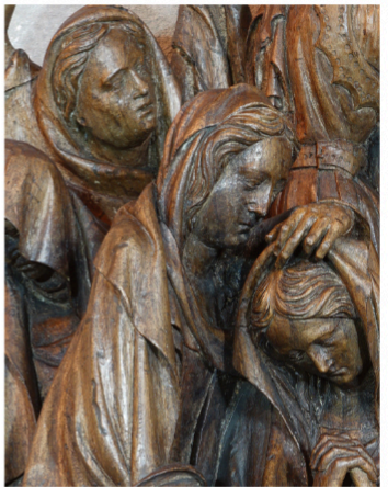
Die Gruppe der unter dem Kreuz trauernden Frauen zeigt ungleichmäßig entfernte Reste einer braunschwarzen Lasur, die mit der helleren Holzoberfläche kontrastiert