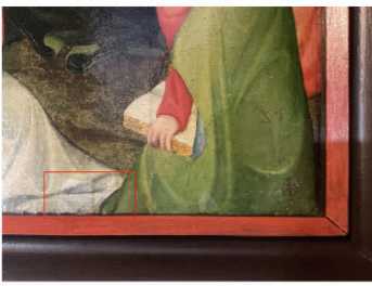
Proben zur Firnisabnahme am linken Retabelflügel (roter Rahmen). Der Firnis ist stark glänzend und verbräunt