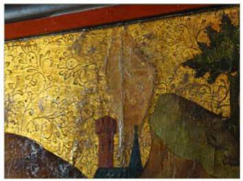
Ergänzung im fein punzierten Goldhintergrund, die dunkel gealterte Retusche wirkt störend