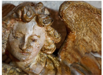
Im Gesicht des Engels wurde links die dick aufgetragene gelbbraune Wachs- und Schmutzschicht entfernt, Hautfarbe und Augenzeichnung werden wieder sichtbar

Gern senden wir Ihnen eine Spendenbescheinigung zu. Bitte teilen Sie uns dazu Ihren Namen und Ihre Anschrift mit. Selbstverständlich können Sie auch anonym spenden.